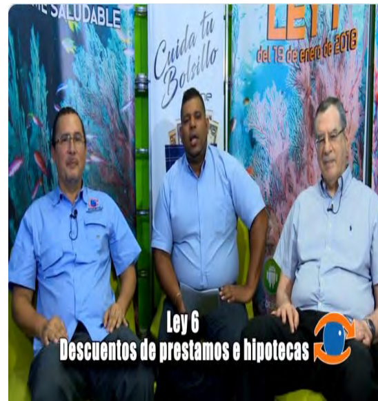
10 de julio :Descuentos y beneficios para jubilados, pensionados y tercera edad préstamos e hipotecas en base a la Ley 6", tema de hoy en #CuidaTuBolsillo on line.