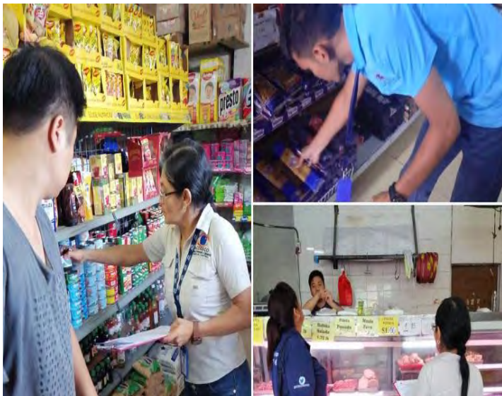
10 de julio: ACODECO, realizó verificación de precios en comercios de San Miguelito.