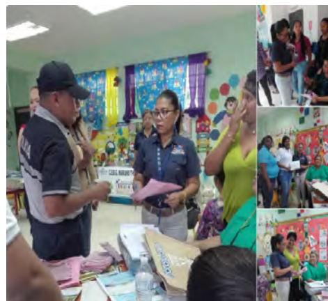
28 de junio: Jornada de orientación sobre la implementación de la Ley 1 de enero de 2018 que promueve el uso de las bolsas reutilizables durante la realización de la Feria de reciclaje en la Escuela 11 de Changuinola.