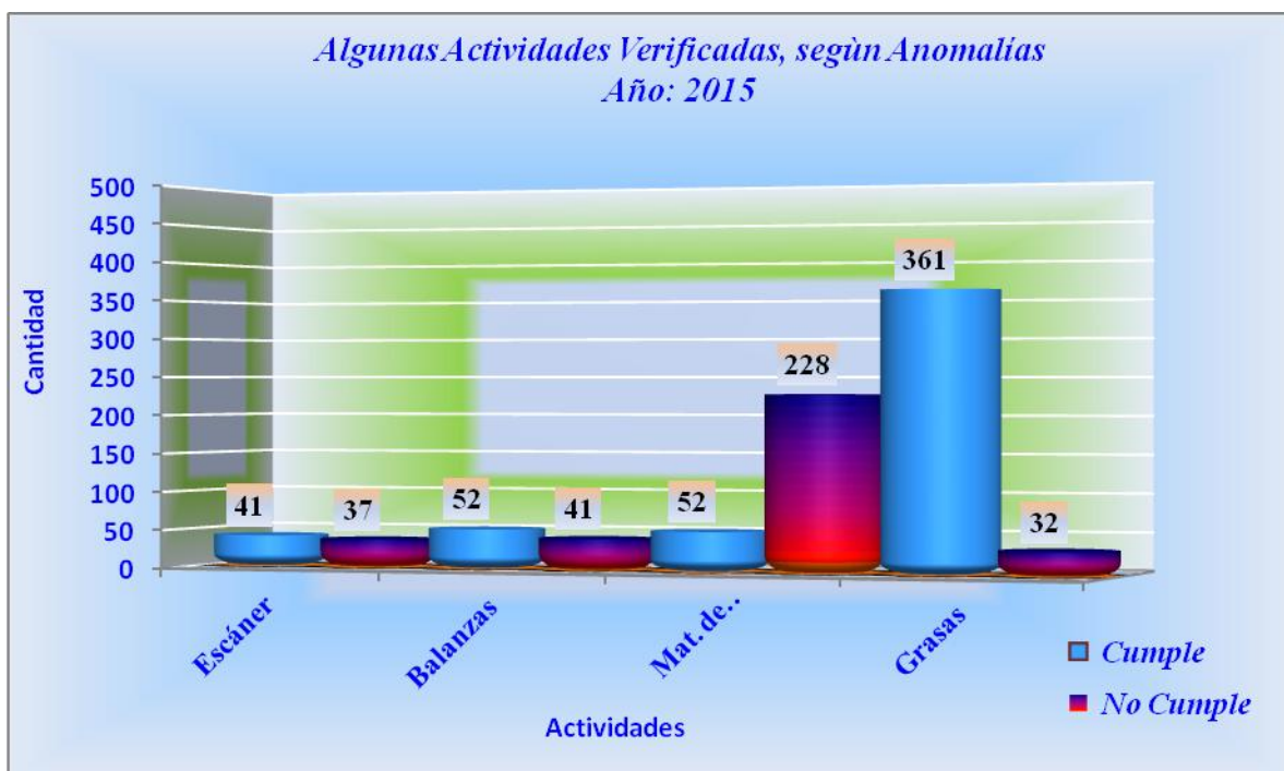
Algunas Actividades Verificadas, según Anomalías Año: 2015