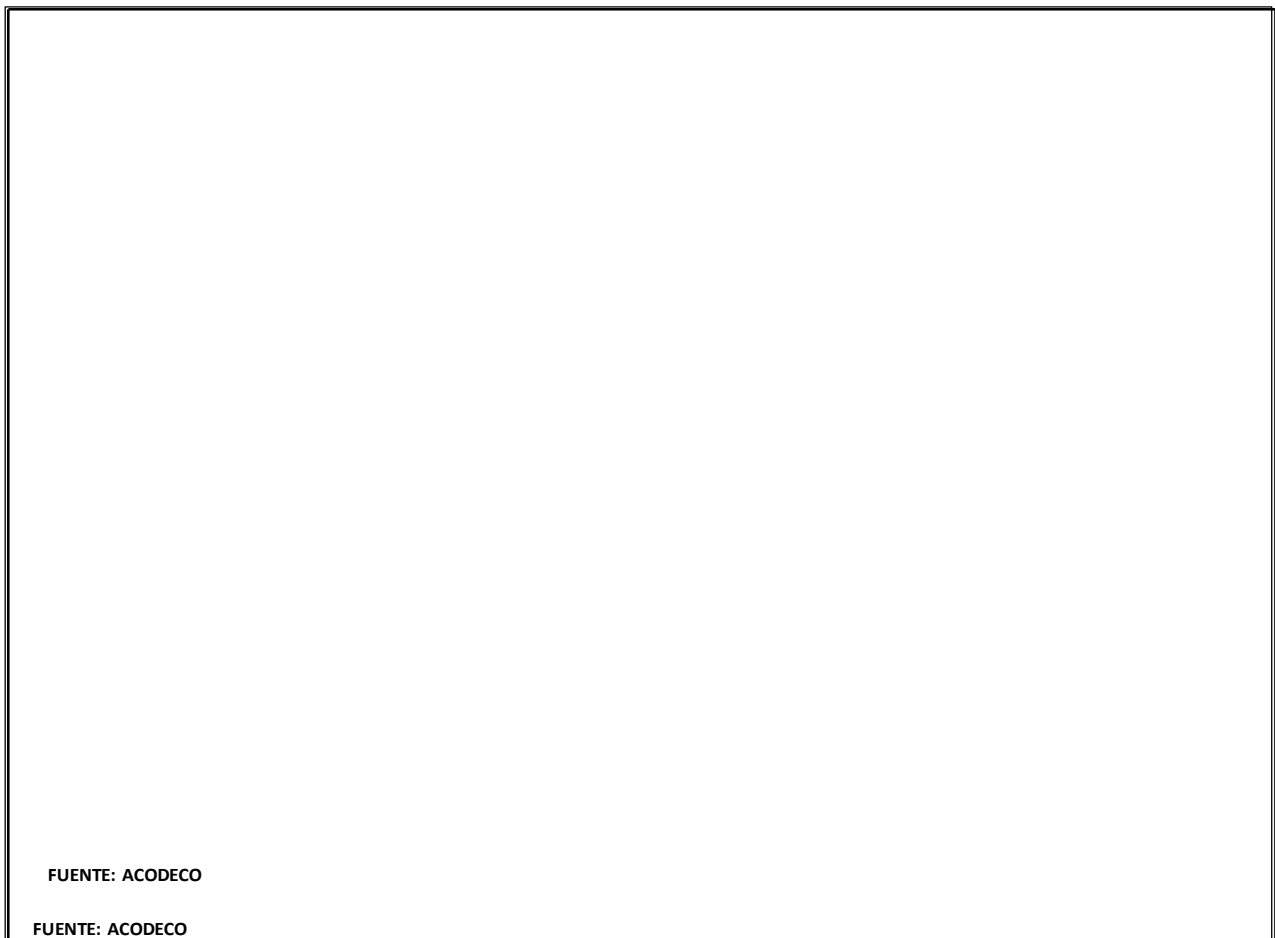
Gráfica No. 2

Al comparar el costo de la CBFA en supermercados con el costo de las Rutas es importante señalar la diferencia que se observa, la cual es de B/.33.23 para el mes de septiembre 2018. (Ver gráfica No. 2).