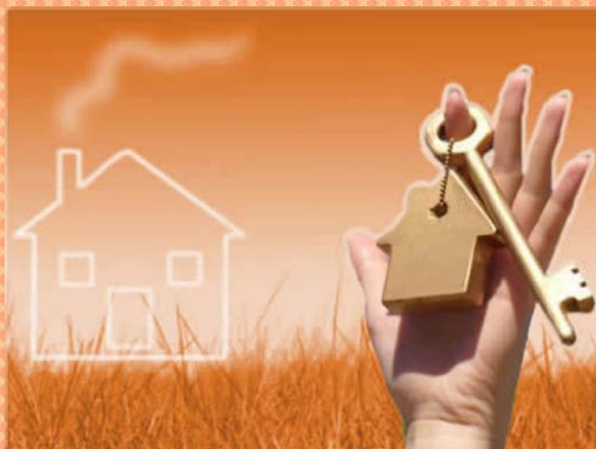
Quejas Sector Inmobiliarias