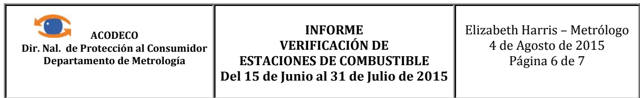
Cuadro Nº 5 - Estadística de Resultados de las Ultimas Verificación de Combustible Realizadas.