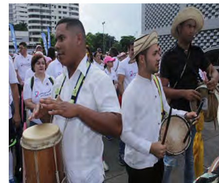
6 de octubre: Acodeco presente en la gran caminata Uniendo Fuerzas contra el Cáncer .